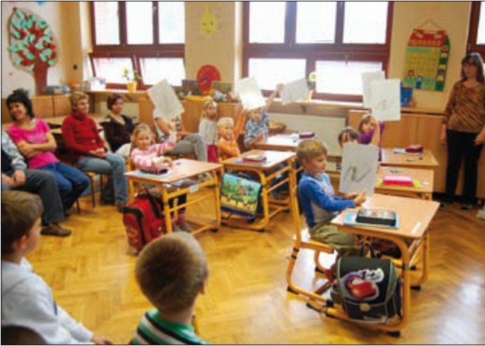
Psaní písmenek na tabulky