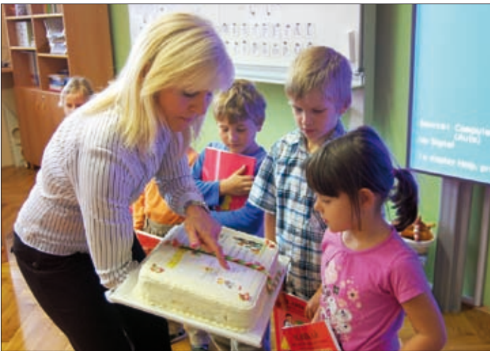
Čtení slov z dortu