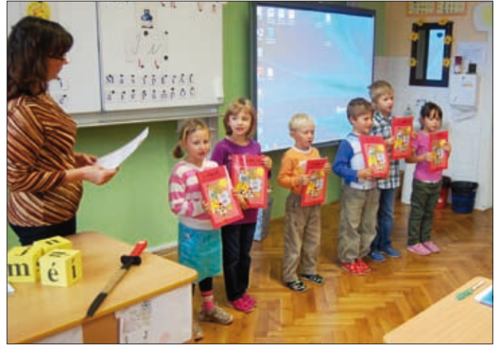
Prvníáci skládají čtenářský slib