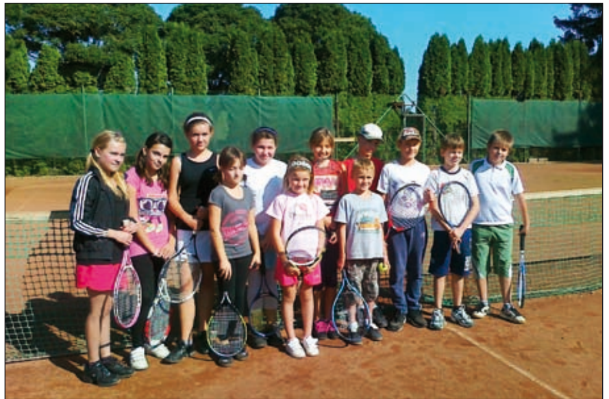
Účastníci Tenisového turnaje mládeže