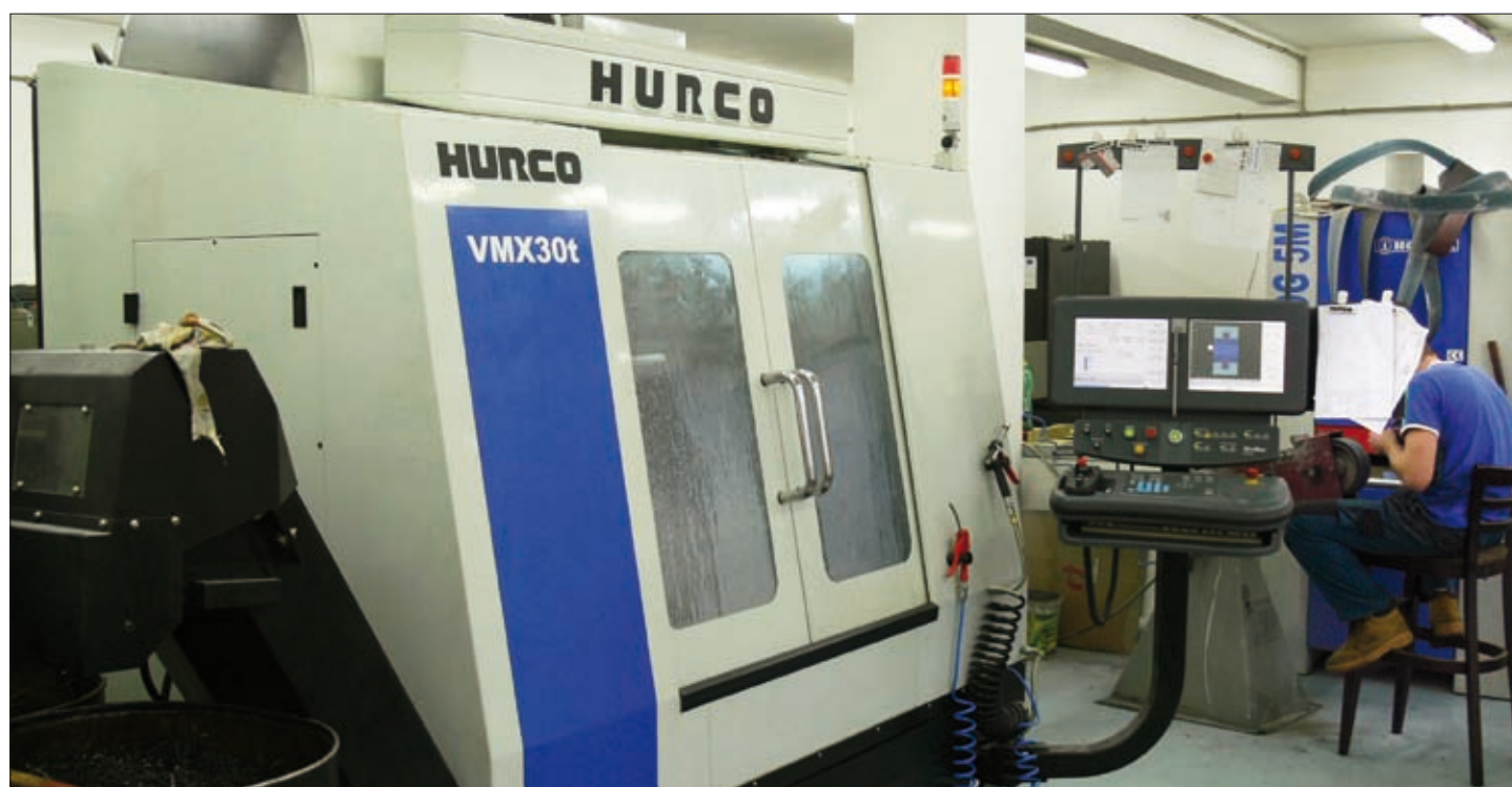
CNC obráběcí centrum pro obrábění dílů pro upínací magnety

Do skupiny v Žalkovicích vyráběných magnetických stolů se kromě výše zmiňovaných obdélníkových a kruhových provedení řadí také specifický typ magnetického stolu, který je díky svým charakteristikám podstatně náročnější na výrobu. Jedná se o tzv. sinusový stůl a hlavní rozdíl oproti standardnímu stolu je v jeho schopnosti naklápět se kolem podélné osy, a to v rozpětí 0° – 45°. Tento stůl tedy dovoluje nastavení upínací plochy v daném úhlu od roviny, což otvírá další možnosti pro přesnější opracování na tento stůl upínaných obrobků. Náročnost výroby tohoto typu stolu spočívá v nutnosti dosáhnout předepsané přesnosti roviny při naklápění. Zde je totiž stanovena maximální hodnota tolerance na \pm 0,005 mm na 100 mm délky upínací plochy, což znamená takovou přesnost, která je neměřitelná standardními měřidly a pro kterou je třeba používat ty nejcitlivější a nejpřesnější měřicí přístroje. Aby si čtenáři udělali lepší představu, nabízí se jednoduché srovnání: tloušťka lidského vlasu se pohybuje kolem hodnoty 0,05 mm, maximální hodnota tolerance u výroby sinusového stolu je \pm 0,005 mm, z čehož vyplývá, že při jeho výrobě se firma pohybuje v prostoru 10x tenčím, než je lidský vlas. Je tedy patrné, že i v Žalkovicích se vyrábí naprosto precizní průmyslové produkty, pro které je využíváno a které se dále využívají jako součást nejmodernějších technologií svého druhu.