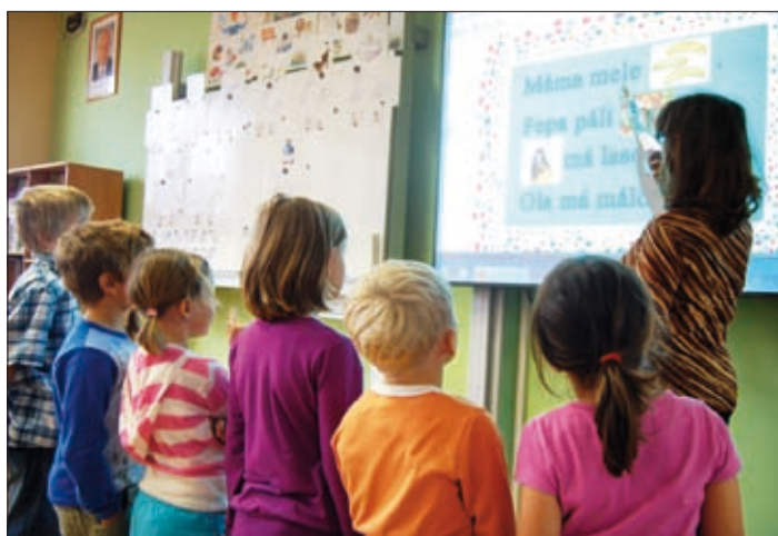
Čtení z interaktivní tabule