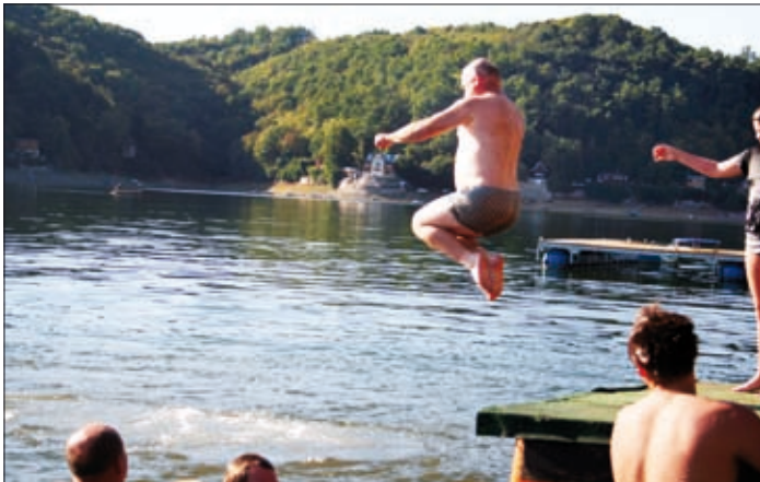
Skok na turka