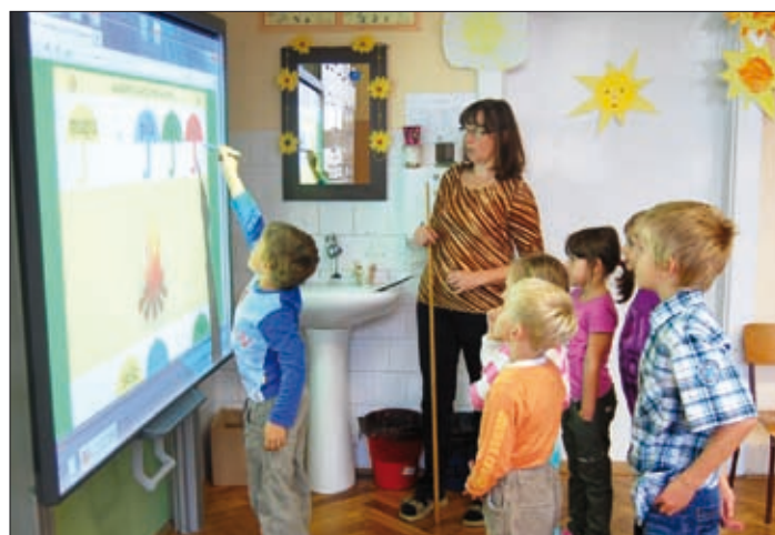
Děti pracují na interaktivní tabuli