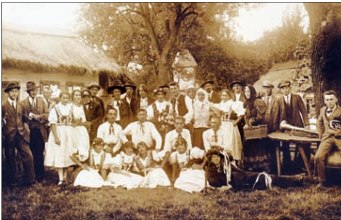
První divadelní představení u Černošků č. 19 v r. 1925. Hra „U sv. Antonička“

I když hrály děti, byla představení vždy bohatá na scénu, kostýmy, osvětlení a nechyběl ani profesionální maskér. Ještě dnes vzpomínají pamětníci na tyto chvíle vzrušení na „prknech, která znamenají svět“.