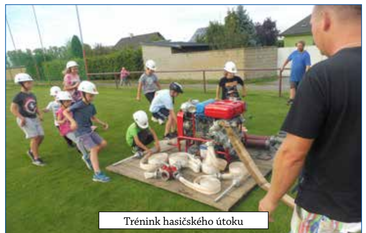
Trénink hasičského útoku