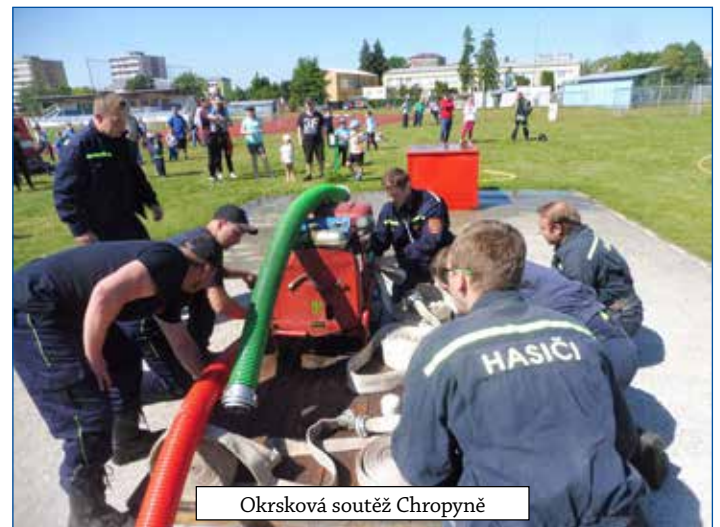
Okřsková soutěž Chropyně