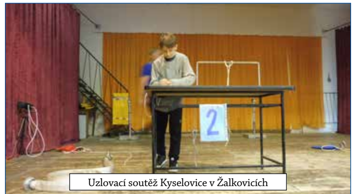
Uzlovací soutěž Kyselovice v Žalkovicích