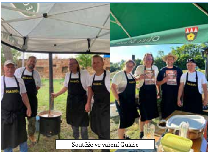
Soutěže ve vaření Guláše