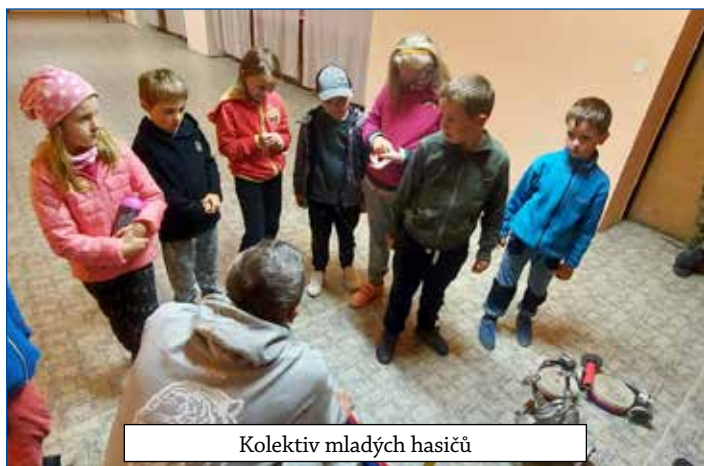
Kolektiv mladých hasičů