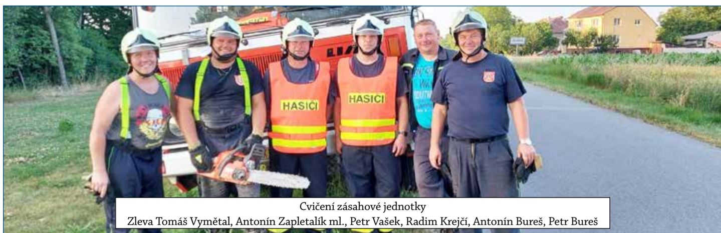
Cvičení zásahové jednotky