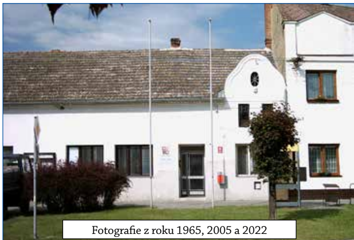
Fotografie z roku 1965, 2005 a 2022

2022 - Byla ukončena rekonstrukce obecního úřadu, kdy knihovna byla přemístěna do bývalého zdravotního zařízení a ze staré knihovny vznikla zasedací místnost pro konání zastupitelstva, vítání občánků a dalších aktivit v obci.