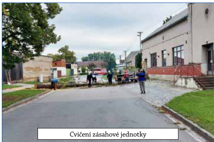
Cvičení zásahové jednotky