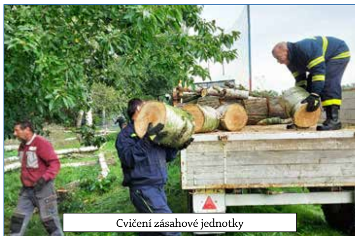
Cvičení zásahové jednotky