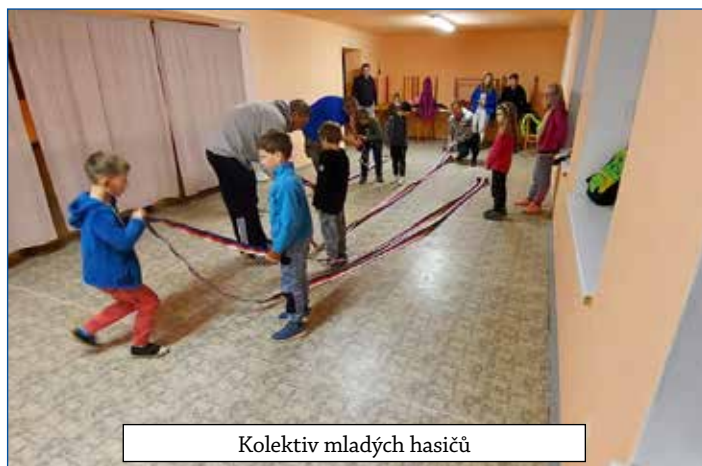
Kolektiv mladých hasičů