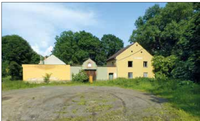
Obr. 4 - Štulbach

V katastru obce Horní Moštěnice , podobně jako u Žákovic, nalezneme hned 2 mlýny. První z nich, nazývaný Štulbach (podle slova „stvola“, staroslovanského názvu druhu vrby, která lemovala břehy Moštěnky), je v kronikách spolu s přílehlou tvrzí zmiňován v kronikách již v roce 1320. Dnes je však celý areál mlýna uzavřen a pomalu zarůstá bujnou vegetací. Co je ale stále dobře patrné, je nápis na štítu budovy, který stále hlásá zašlou slávu mlýna Štulbach. Vstupní část areálu je pak vidět na obr. č. 4.