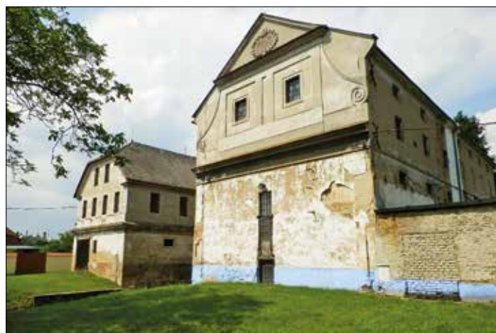
Obr. 6 - Vlkoš

V polích mezi Vlkošem a Kyselovicemi, v části obce zvané Kanovsko , stál již od 15. století tzv. Polňák. S tímto mlýnem, který nesl označení podle svého umístění, jsou historicky spojeny zejména spory a konflikty. V kronikách se velmi často objevují zmínky o sporech vrchnosti a provozovatelů Polňáku. Vrchnost