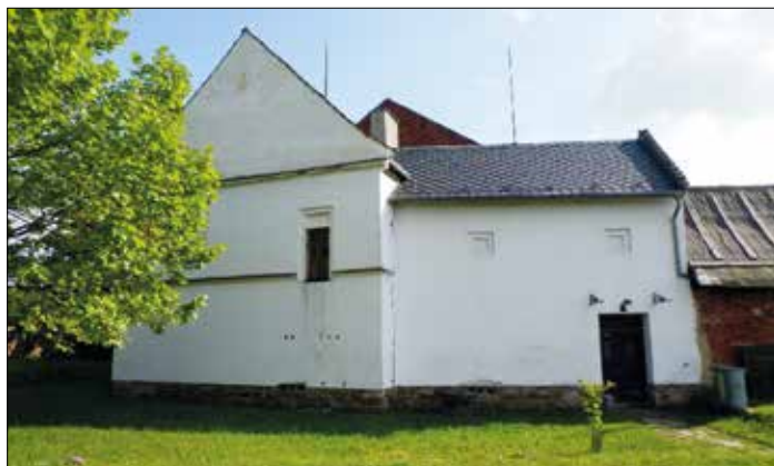
Obr. 2 - Radkovy