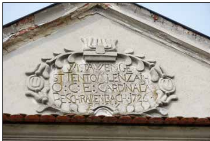
Obr. 5 - Nápis na mlýně ve Vlkoši

Dvě dodnes zachovalé mlýnské budovy, mezi kterými protéká Mlýnský náhon, se však nachází v obci Vlkoš . Na jedné z nich je dobře čitelný zdobný nápis, který říká, že budova v této podobě byla postavena arcibiskupstvím v roce 1726 (obr. č. 5). V prostoru náhonu se také do dnešních dnů dochovala dřevěná hřídel vodního kola úctyhodných rozměrů. Majestátnost vlkošského mlýna ukazuje obr. č. 6.