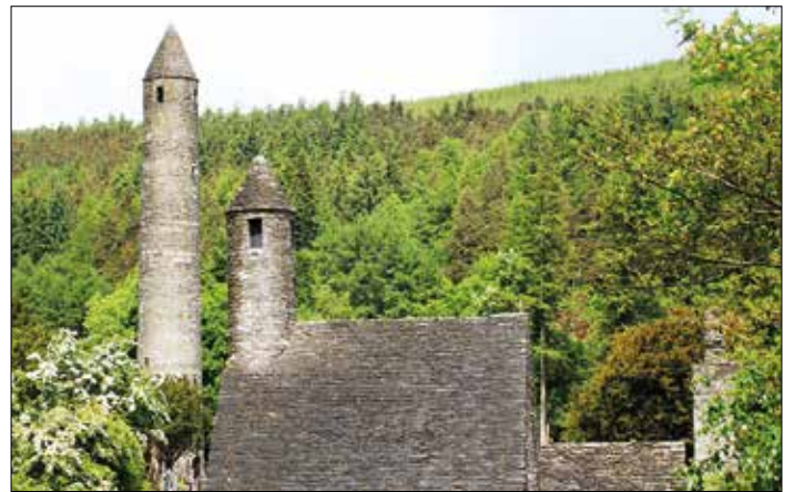
Kostelík Sv. Kevina