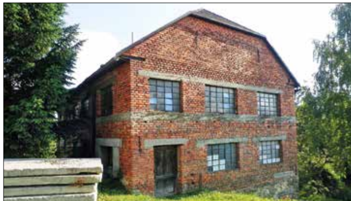
Obr. 1 - Vítonice

Po opuštění Vítonic se Moštěnka vlévá do katastru obce Žákovice , kde svou činnost provozovaly hned 2 mlýny. První z nich, tzv. mlýn Pospíšilův (podle majitelů – rodiny Pospíšilových, kteří mlýn koupili v roce 1911), doznal v průběhu let také mnoha modernizačních úprav (nejvýznamnější byla instalace vodní turbíny a přístavba dalších podlaží), ale ani jeho činnost nebyla za minulého