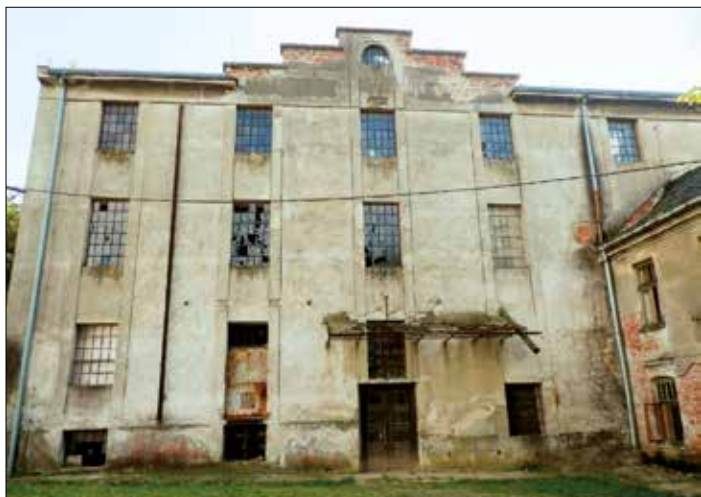
Obr. 3 - Čechy

Za obcí Radkovy pokračují vody Moštěnky po několik kilometrů ničím nerušeným tokem, míjí několik sídel, až se dostanou na území obce Čechy . Zde dodnes na č. p. 48 stojí již od 15. století tzv. český mlýn, na jehož fasádě je dobře čitelný letopočet 1932, kdy budova vyhořela. Existence mlýna však touto událostí nekončí. Po požáru byla budova opravena, zmodernizována, osazena dvěma vodními turbínami a elektrifikována. Avšak ani tento mlýn již dnes není v provozu. Mletí zde bylo ukončeno v roce 1953 a vodní náhon byl zcela zrušen. Majestátní budova českého mlýna, kterou v současnosti vlastní obec Čechy, je zobrazena na obr. č. 3.