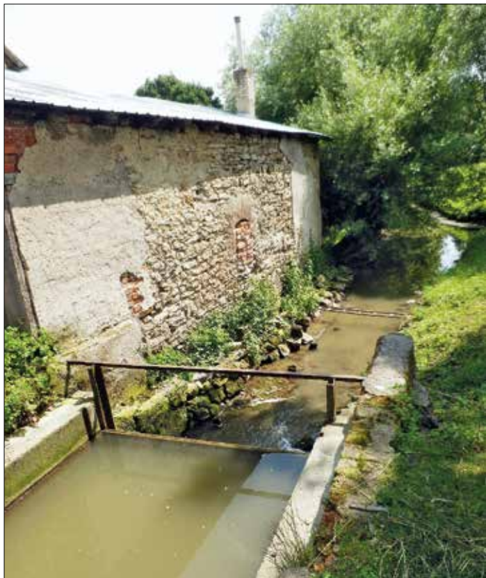
Obr. 7 - Polňák

např. obviňovala kanovského mlynáře, že si upravuje jez podle svých potřeb a tím díky zvýšené hladině náhonu způsobuje nemalé škody mlynáři ve Vlkoši. Kanovský mlynář si zase stěžoval na toho vlkošského, že mu v zimě tzv. staví vodu a tříští. Tyto a obdobné spory se pak v různé intenzitě vlekly celá desetiletí. Osud Polňáku se pak naplnil v létě roku 1937, kdy vznikl z neznámých příčin požár, který nenávratně zničil budovu i veškeré vnitřní zařízení. Po tomto neštěstí již nebyl mlýn nikdy obnoven a dnes je možné na jeho místě nalézt pouze část vodního s malým vodním spádem, který je zachycen na obr. č. 7. Ironie osudu je pak dokreslena skutečností, že mezi uvedením do provozu po rozsáhlé rekonstrukci mlýna a vznikem požáru uplynuly pouhé dva dny.